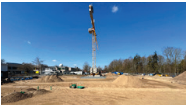
ERSATZNEUBAU ZWEIFELD SPORTHALLE SCHÖNBERG