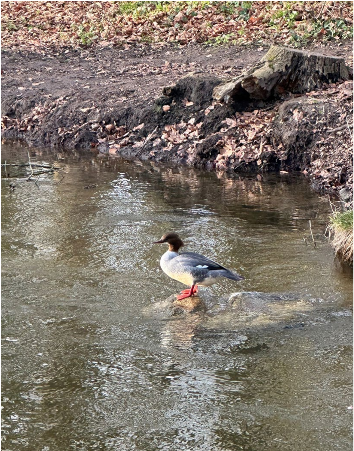
Gänsesäger, ein eher seltener Gast in der Hagener Au und vermutlich nur auf der Durchreise